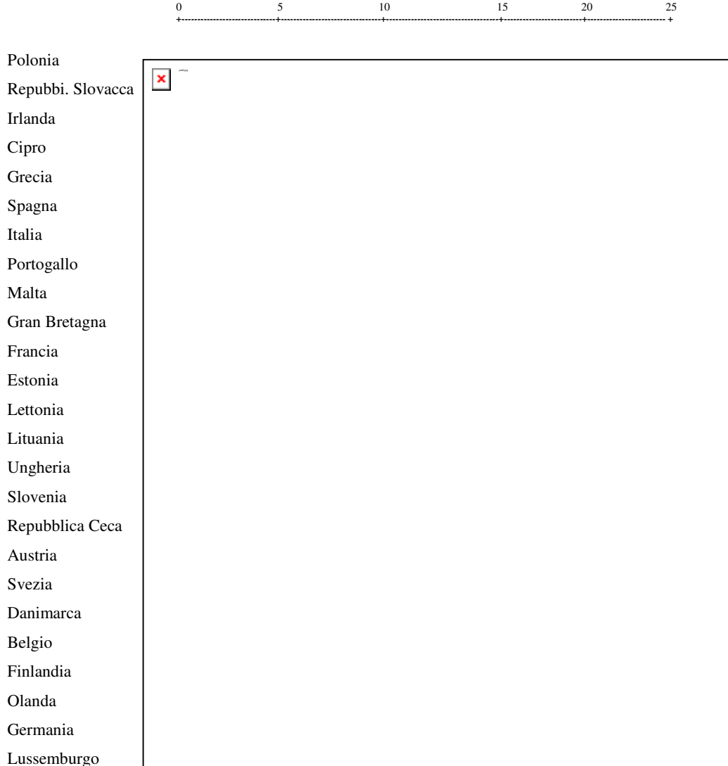
Fig. 1.3 – Dendrogramma