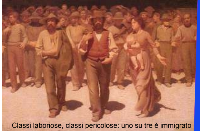
Classi laboriose, classi pericolose: uno su tre è immigrato

un fenomeno, di cui ci si nasconde le cause reali.